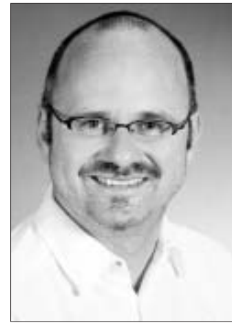
Autoren dieses Beitrages sind Zahnarzt Andreas Raßloff und Dr. Andreas Hein, JUVENTIS Tagesklinik.

Die Behandlung: Ziel einer zahnärztlichen Therapie ist die Schaffung hygienischer Verhältnisse. Hierfür müssen der Biofilm und der auf der Wurzeloberfläche anheftende Zahnstein entfernt werden. Es ist dabei jedoch nicht (!) notwendig, das Wurzelzement durch Kürettage oder das gesamte Granulationsgewebe in der Tasche zu entfernen. Das mit der Behandlung einhergehende Weichgewebstrauma sollte möglichst minimiert werden.