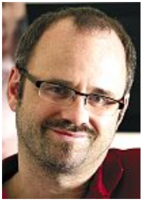
Autor des Beitrages: Andreas H. Raßloff Zahnarzt

Hier finden Sie Ärzte bzw. Arztpraxen sortiert nach fachlichen Schwerpunkten. Weitere Schwerpunkte können jederzeit ergänzt werden