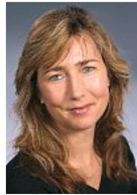
Autorin des Beitrages: Heike Bleck-Keller Prophylaxespezialistin „prophykonzept“

Hierzu liegen aussagekräftige Langzeitstudien vor, die belegen, dass gut motivierte Patienten, deren Mundhygiene